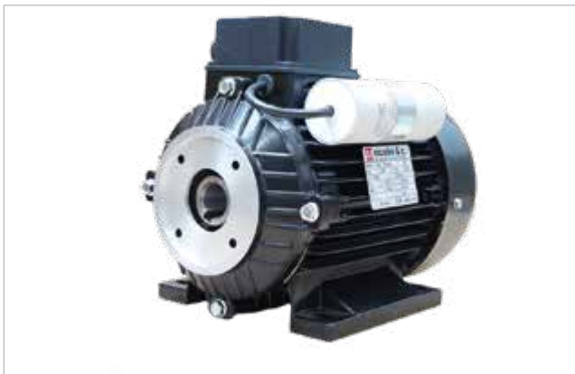
E-motor - 450200 / 450205 / 450207