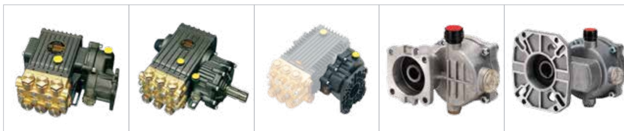
RS99 / 502020