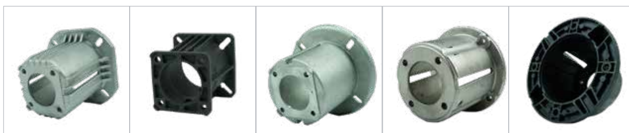
ZF044 / 502200