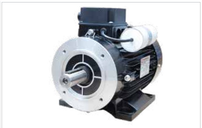
E-motor - 450235