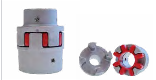
502250 t/m 502255