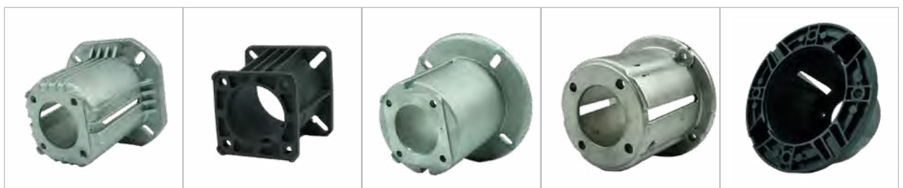
ZF044 / 502200