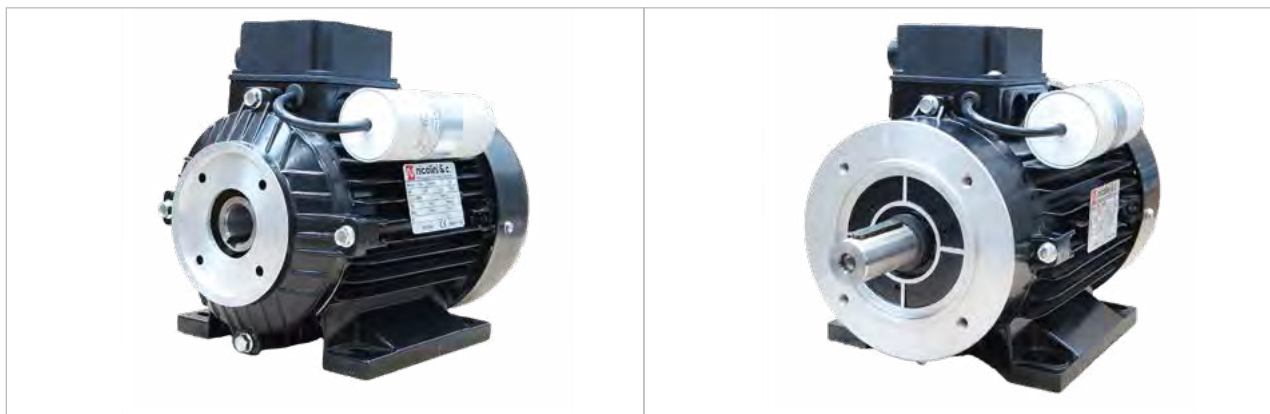
E-motor - 450200 / 450205 / 450207