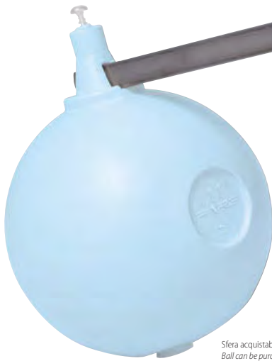
Sfera acquistabile a parte. Ball can be purchased separately.

Adjustable noiseless float valve in pressed and casting brass for high pressure equipped with inlet pipe, with flat rod.