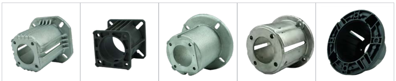
ZF044 / 502200