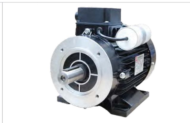
E-motor - 450235