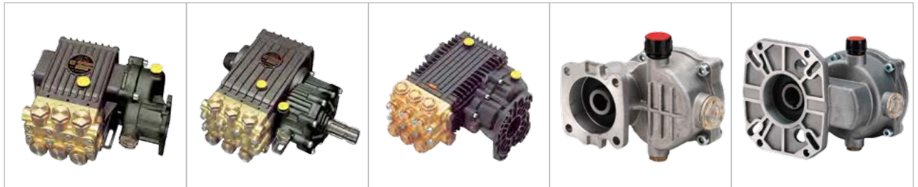
RS99 / 502020