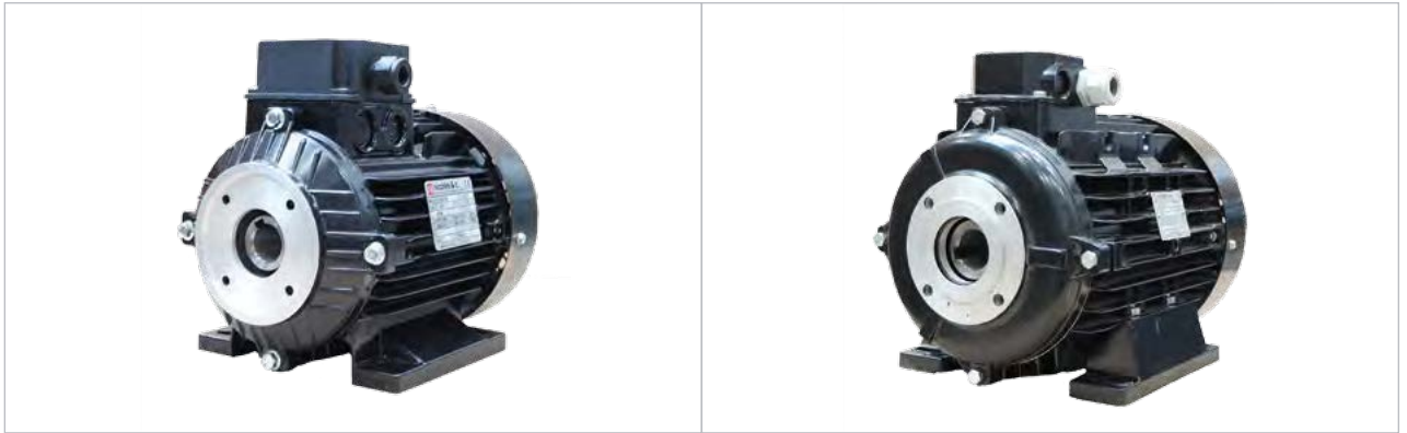
E-motor - holle as/ 450002