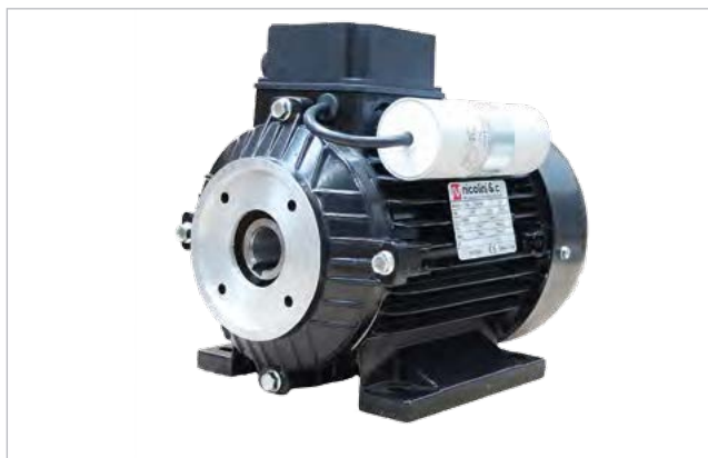
E-motor - 450200 / 450205 / 450207